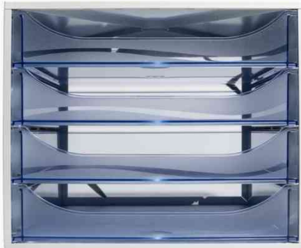
Schubladenbox ECOBOX, grau / eisblau