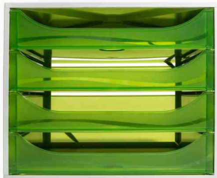
Schubladenbox ECOBOX, grau / apfelgrün

- für die Ablage von Dokumenten aller Art