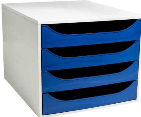
Schubladenbox ECOBOX, grau / nachtblau