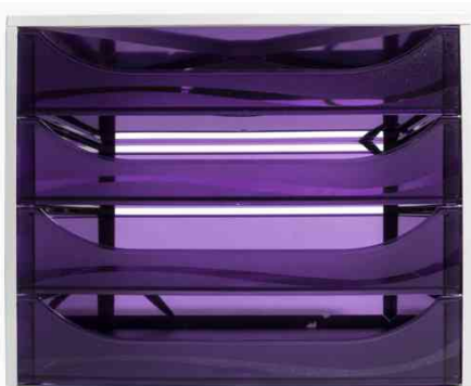
Schubladenbox ECOBOX, grau / violett