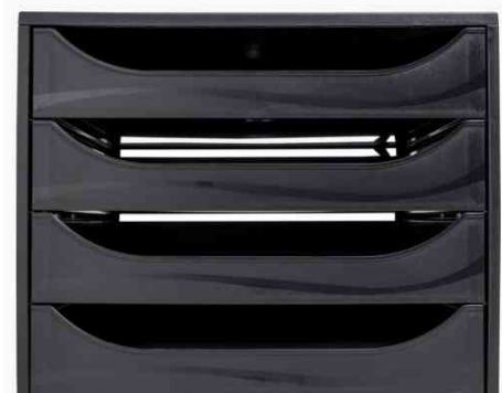
Schubladenbox ECOBOX, schwarz / schwarz