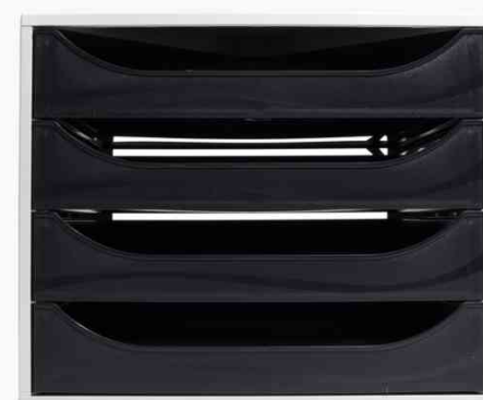
Schubladenbox ECOBOX, grau / schwarz