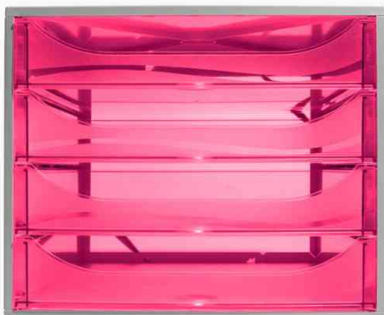
Schubladenbox ECOBOX, grau / himbeer