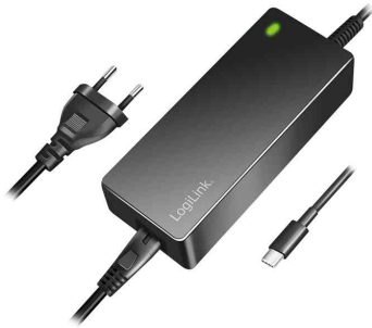
Universal Netzteil für Notebooks, 100 Watt