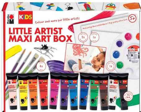
Maxi Art Box LITTLE ARTIST

- ideal für kleine und große Künstler:innen, die mehr wollen - speziell entwickelt für Kinder 5 Jahren