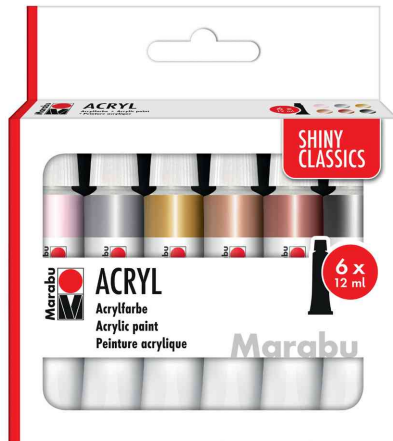
Acrylfarben-Set SHINY CLASSICS