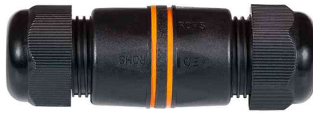
Outdoor Patchkabel-Verbinder Kat. 6