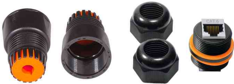
Outdoor Patchkabel-Verbinder Kat. 6