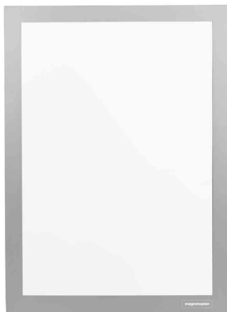
Magnetrahmen magnetofix, selbstklebend, silber