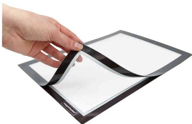
Detailansicht: aufklappbarer Magnetverschluss