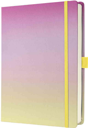
BuJo Notizbuch Jolie "Gradient Icecream"

- viel Platz zum Zeichnen, Illustrieren und Notieren