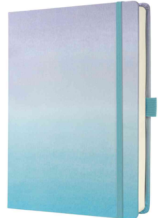
BuJo Notizbuch Jolie "Gradient Sky"