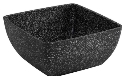
Schale FROSTFIRE, 190 x 190 mm