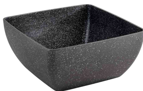
Schale FROSTFIRE, 250 x 250 mm