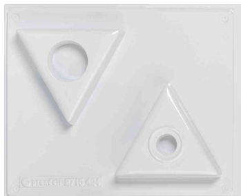
Gießform Kerzenhalter, Dreiecke

- für das Gießen von kleinen Gipsobjekten