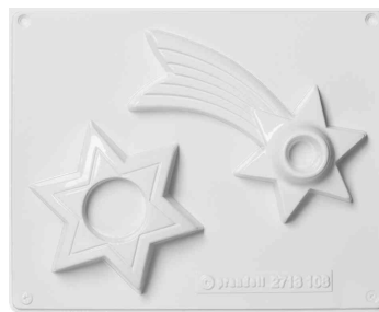
Gießform Kerzenhalter, Sterne