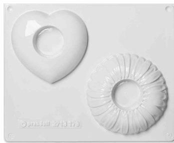
Gießform Kerzenhalter, Herz und Blume