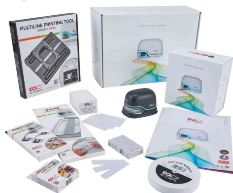
Mobiler Drucker e-mark Professional - Starter-Set