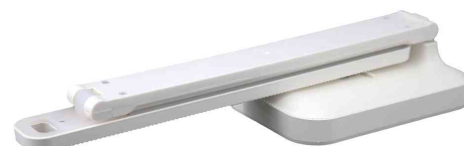
Akku-LED-Tischleuchte KAPA, platzsparend faltbar