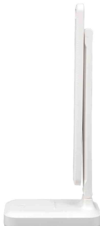
Akku-LED-Tischleuchte KAPA, klappbar