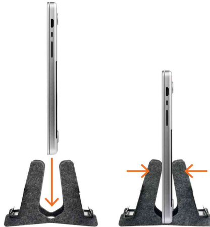
Detailansicht (Lieferung ohne Notebook)