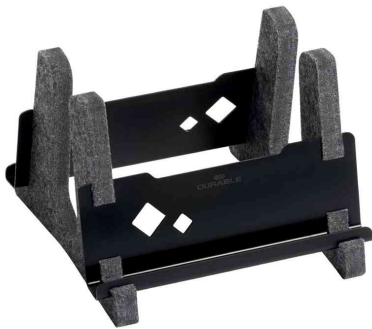
Notebook-Ständer VERTICAL EFFECT