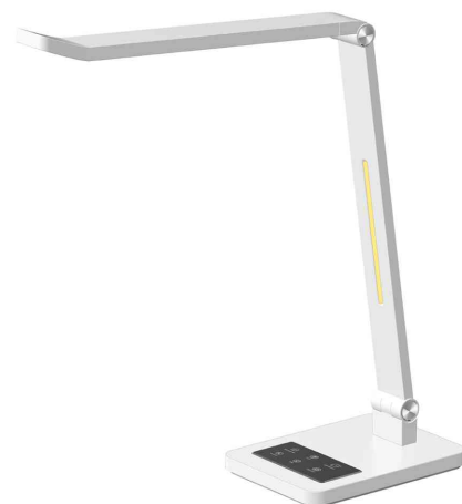
LED-Tischleuchte Tide, weiß