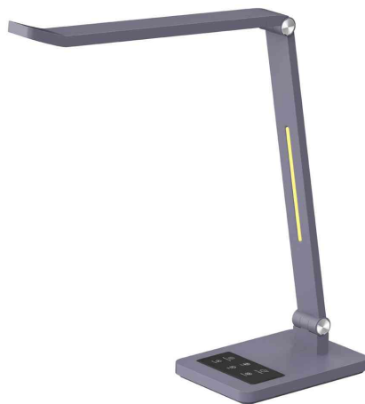
LED-Tischleuchte Tide, metallic grau