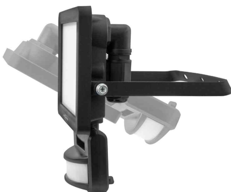
LED-Wandstrahler LUMINARY WFL10W-S, einstellbar