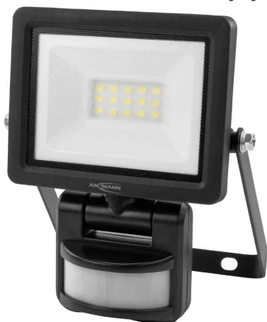
LED-Wandstrahler LUMINARY WFL10W-S