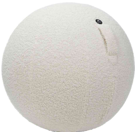
Sitzball "MHBALL", weiß