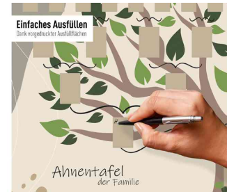
Detailansicht: Einfaches Ausfüllen