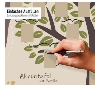
Detailansicht: Einfaches Ausfüllen