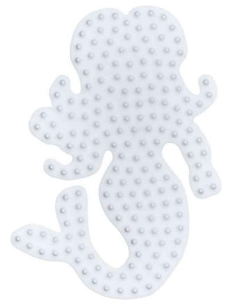
Stiftplatte midi "Meerjungfrau"