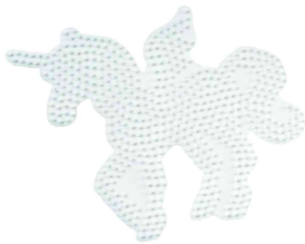
Stiftplatte midi "Pegasus / Einhorn"