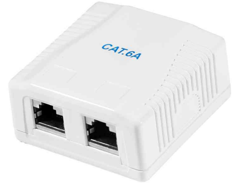
Anschlussdose Kat.6A mit Aufputzbox, 2 x RJ45