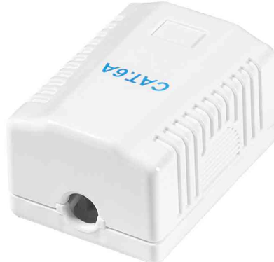
Anschlussdose Kat.6A mit Aufputzbox, 1 x RJ45