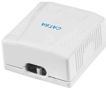
Anschlussdose Kat.6A mit Aufputzbox, 2 x RJ45