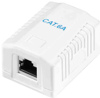
Anschlussdose Kat.6A mit Aufputzbox, 1 x RJ45

- geeignet für alle Datenübertragungen bis Gigabit Ethernet inklusive PoE und PoE+