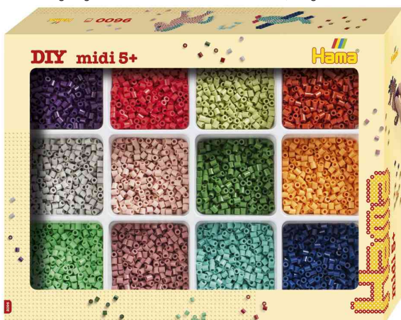
Bügelperlen midi "Sortierbox", gefüllt

ACHTUNG! Nicht geeignet für Kinder unter 36 Monaten, wegen verschluckbarer Kleinteile.